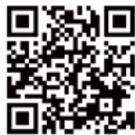
〈専用申込フォーム〉